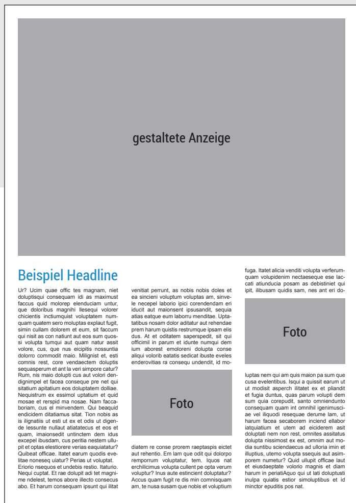
Beispiel mit Platz für 2890 Zeichen Text (inkl. Leerzeichen)

Sie haben in Ihrer Bestellung Ihren Platzbedarf gebucht. Wir empfehlen, damit der informative Charakter gewahrt bleibt, eine Mischung aus gestalteter Anzeige und PR Text (über ihre Ausbildung oder ihr Unternehmen). Im folgenden zeigen wir Ihnen Beispiele hierfür. Die Gestaltung der Seite übernehmen wir für Sie kostenlos! Sie bekommen nach Erhalt der Daten einen Freigabeabzug.